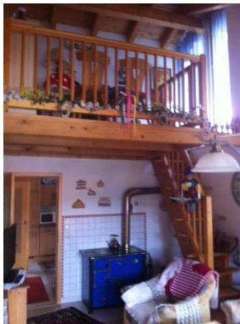
Wohnen + Galerie