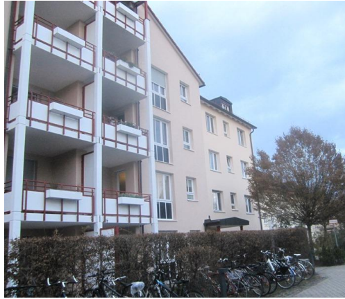
Objekt Nr. 4007