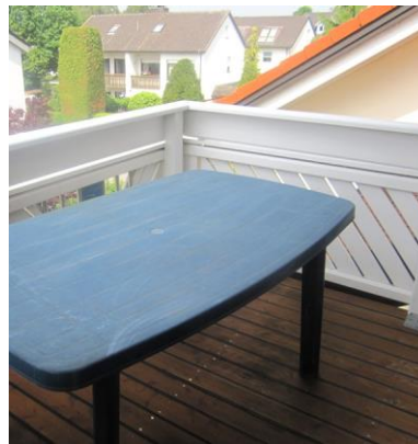
Balkon (vom Schlafzimmer)