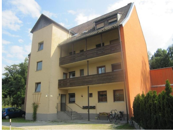
Objekt Nr. 4221