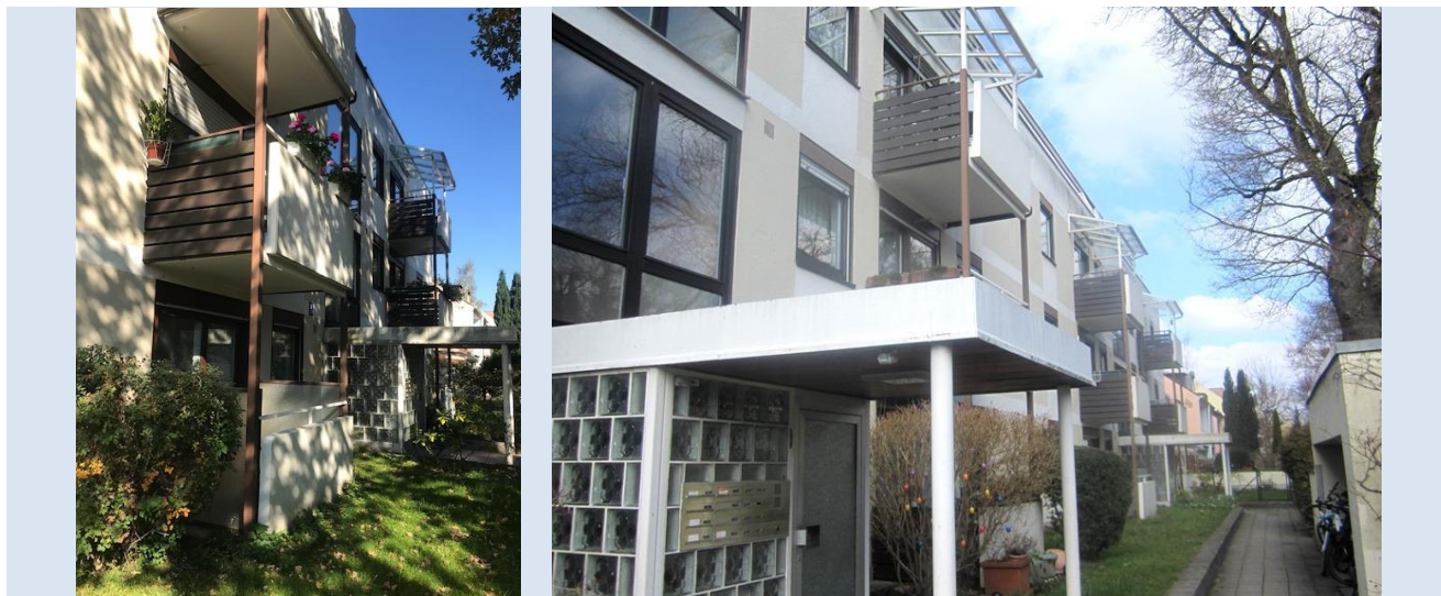
Objekt Nr. 4228