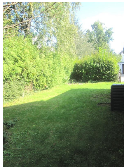
Objekt Nr. 4240

Grundstücksfläche: ca. 794 m 2 Wohnfläche: ca. 100 m 2 Baujahr: 50iger Jahre