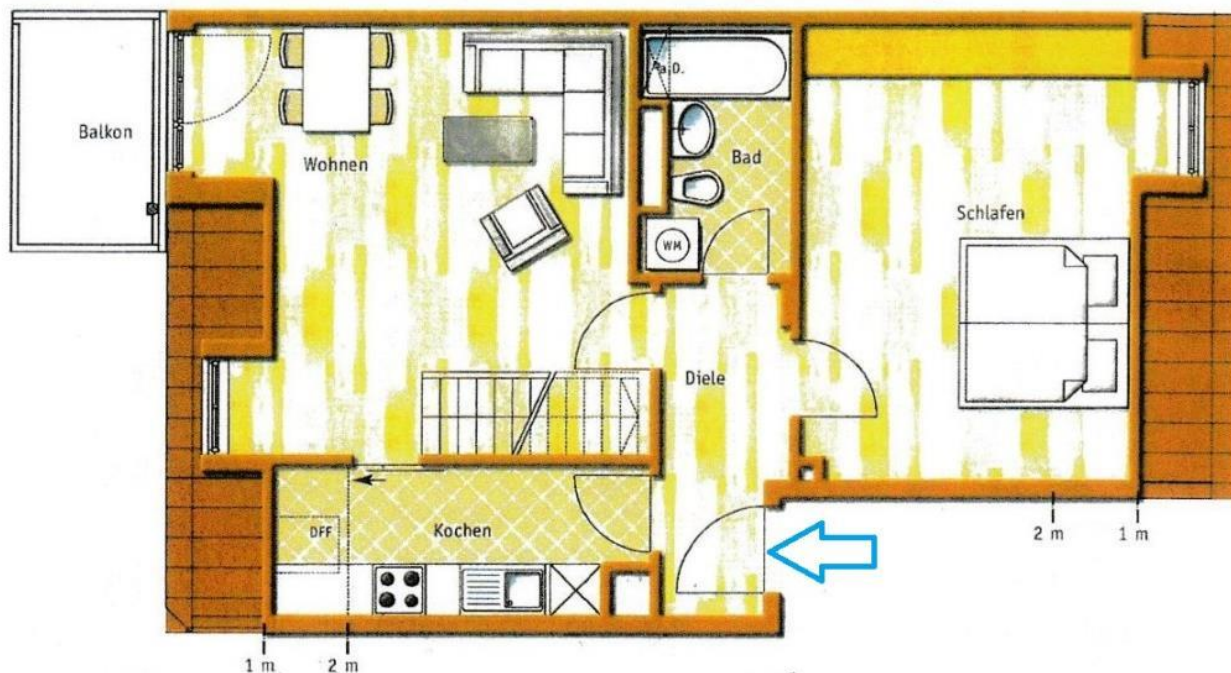
Grundriss 1. OG

Diese Grundrisse sind nicht maßstabsgetreu! Die Unterlagen wurden uns vom Auftraggeber übermittelt, daher können wir für die Richtigkeit keine Gewähr übernehmen!