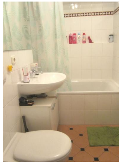
Bad im 1. OG