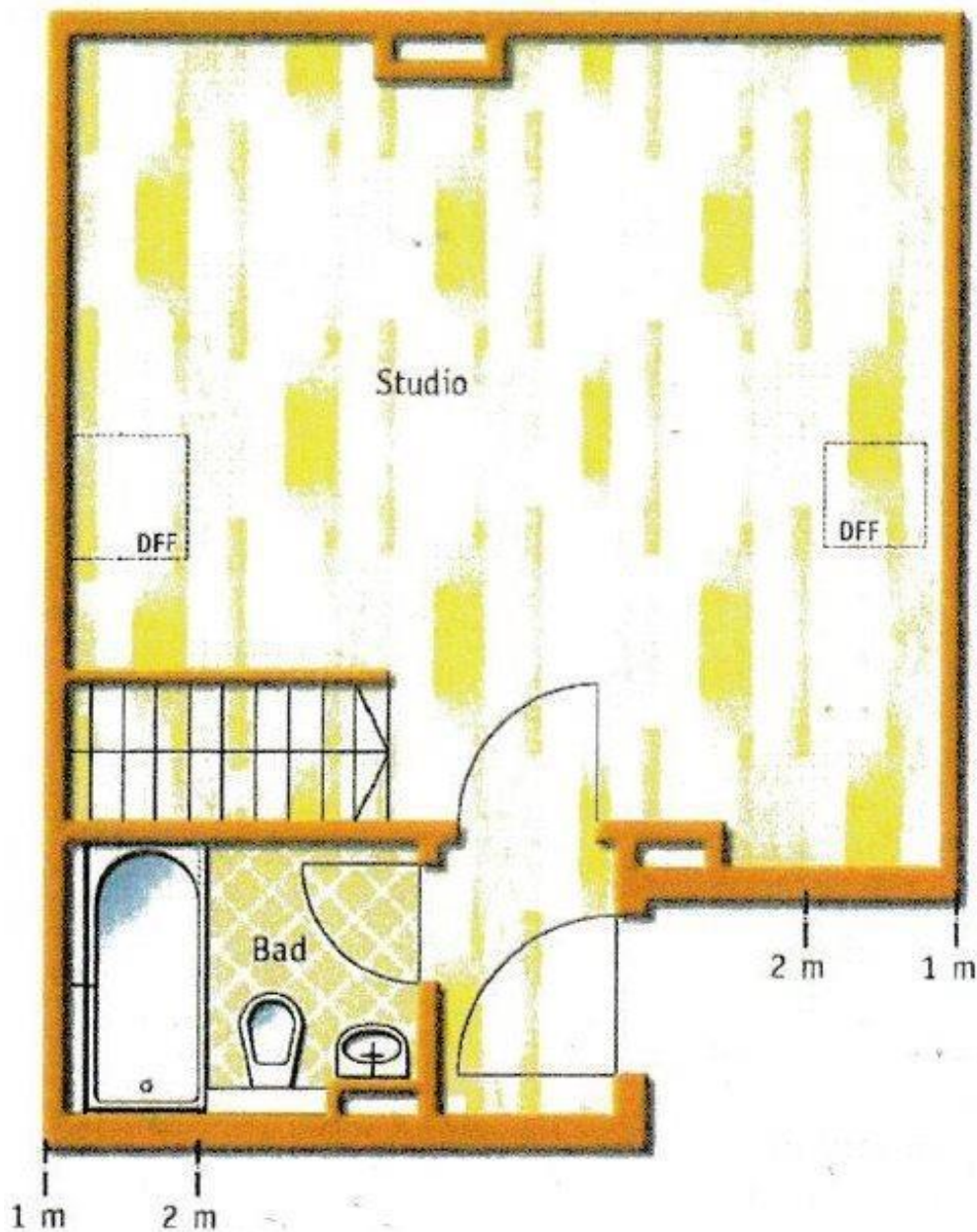
Grundriss Galerie – 2. OG – oberstes Stockwerk

Diese Grundrisse sind nicht maßstabsgetreu! Die Unterlagen wurden uns vom Auftraggeber übermittelt, daher können wir für die Richtigkeit keine Gewähr übernehmen!