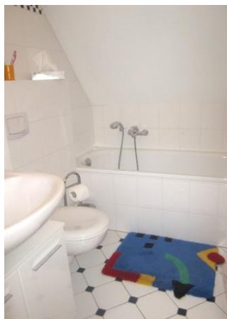
Bad im 2. OG