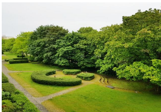
Objekt Nr. 4382