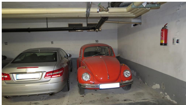
Tiefgaragen-Stellplatz Nr. 10