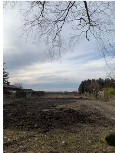
Objekt Nr. 4474