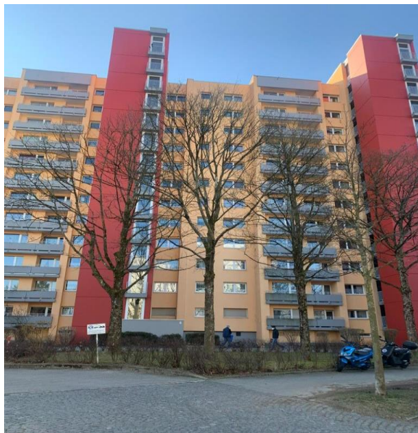
Objekt Nr. 4485

in 81737 München-Neuperlach, Annette-Kolb-Anger