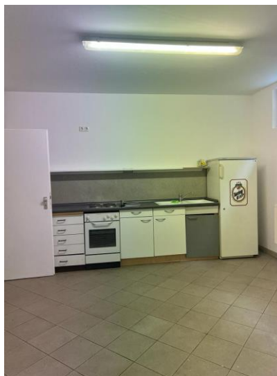
Raum 1 mit Küchenzeile