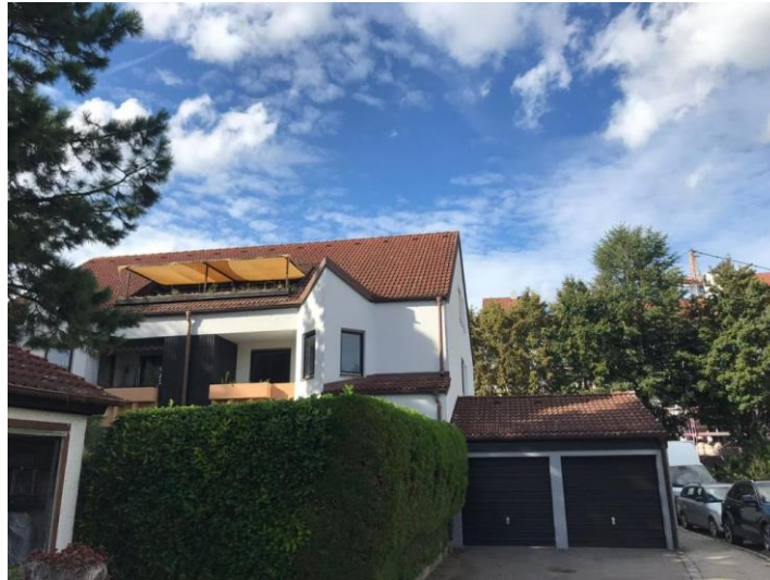
Objekt Nr. 4559