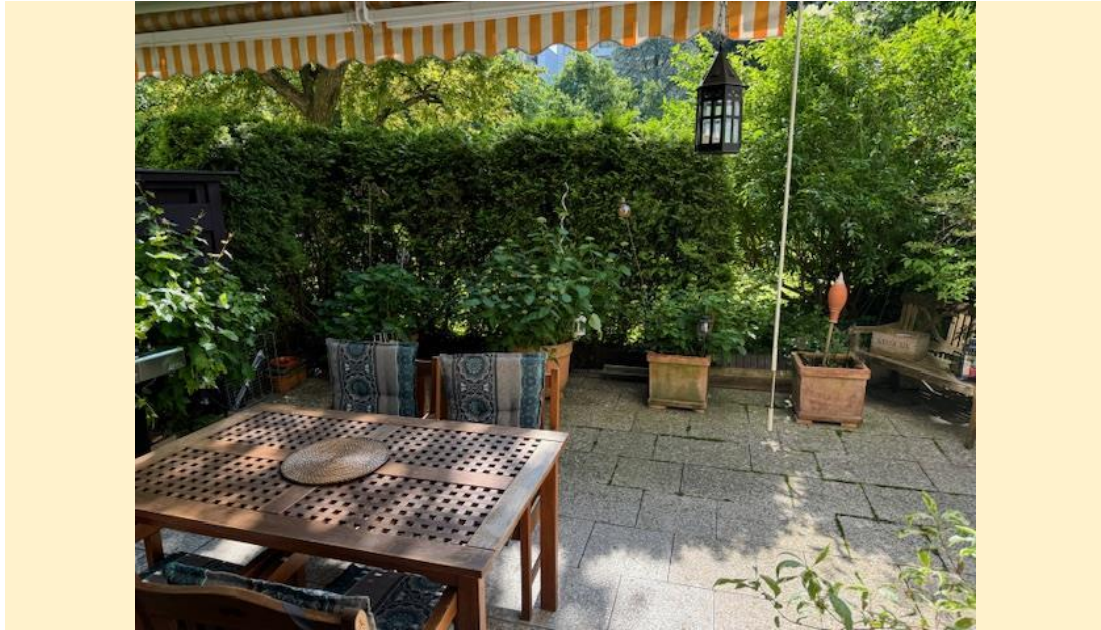
Objekt Nr. 4608