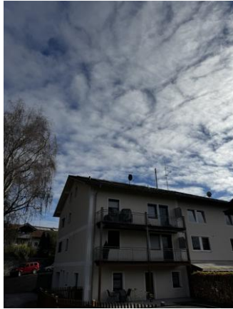
Objekt Nr. 4662